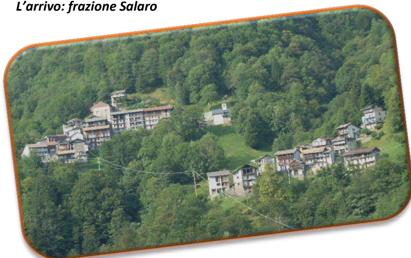
L'arrivo: frazione Salaro